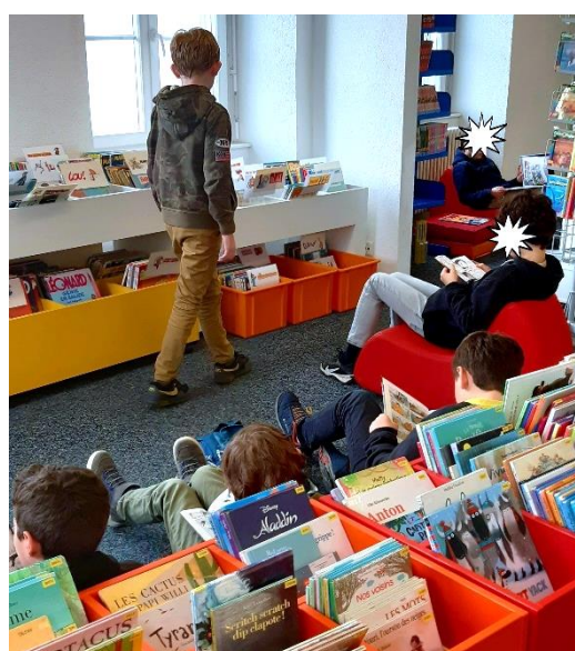
Un après-midi à la bibliothèque...