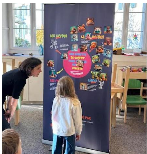
Atelier nutrition – Association Graines de savoir

Enfin, la participation au Cully Bazar a été un succès. La synergie avec le vide-dressing qui se tenait dans le hall de la bibliothèque a permis de créer un événement convivial et attractif, renforçant le rôle de la bibliothèque comme lieu de rencontre et de partage au cœur de la communauté.