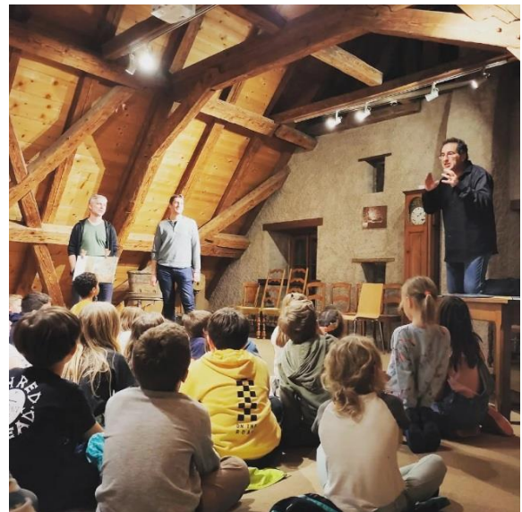
Nuit du conte